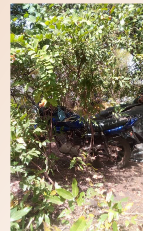
Des images d'une base démantelée par les unités au cours de l'opération FELEHO