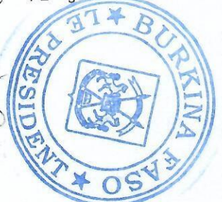
Capitaine Ibrahim TRAORE